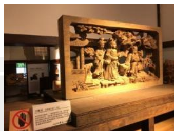
▲ 定期參與木博館各項展覽，更新課程內容。