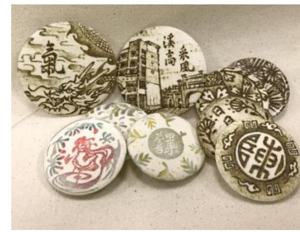
▲烙畫徽章工具及成品範例