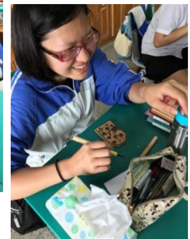
▲實際構圖與刻製情形