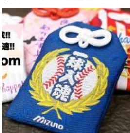
▲ 介紹日式御守特色與美感表現