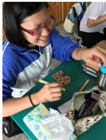
▲ 實際構圖與刻製情形