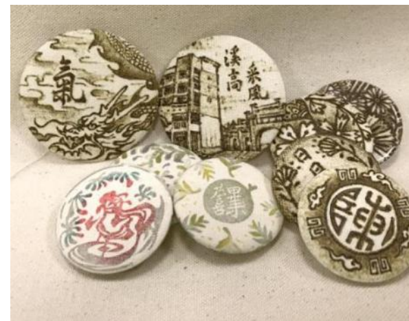
▲ 烙畫徽章工具及成品範例