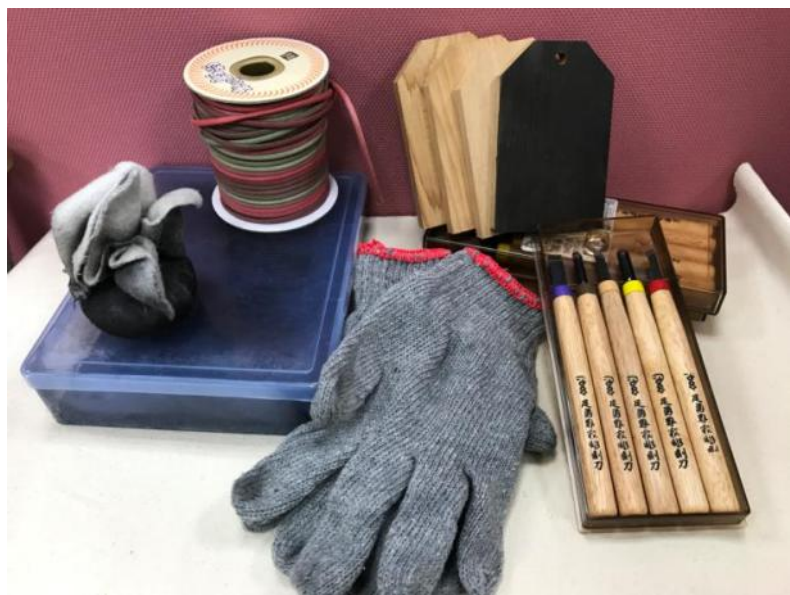
▲ 本次實作木刻御守、媒材與工具