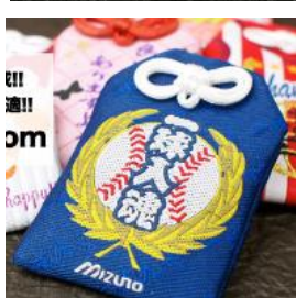
▲ 介紹日式御守特色與美感表現