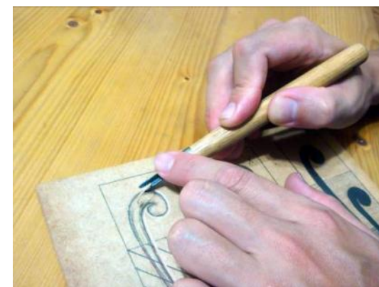
▲ 雕刻工具及安全注意事項